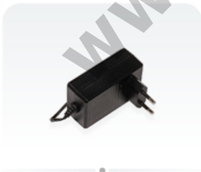
48 V 0.95 A power adapter